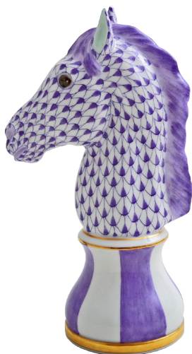
Sakkfigura, huszár Chess Piece, Knight 15112-0-00VHL