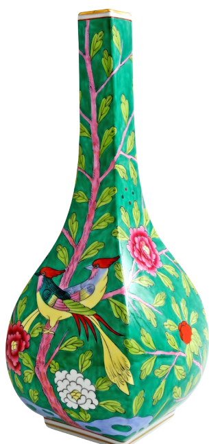
Váza Vase 07081-0-00MACV