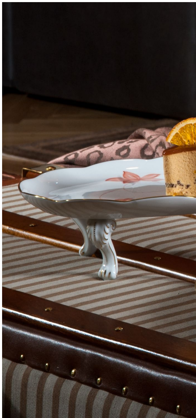
lazacszín • érzékiség, vágyakozás