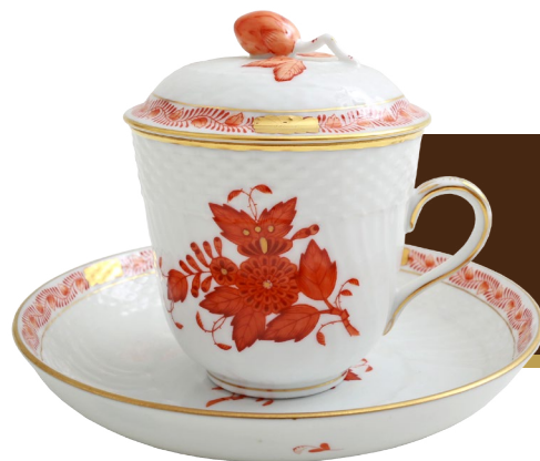
Levescsésze aljjal Soupcup with saucer 01705-0-11AOG