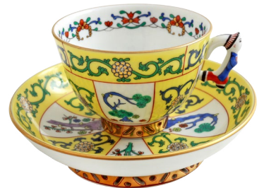
Mokkáscsésze aljjal Moccacup with saucer 03371-0-21SJ