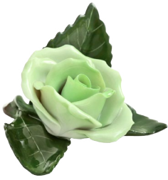
Étrendtartó rózsza Rose on leaf 08983-0-00C-G