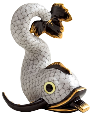
Delfin Dolphin 05398-0-00ECANVT