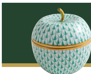
Bonbonnier Bonbonniere 06103-0-02VHV