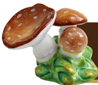
Étrendtartó Menu-holder 08974-0-00C