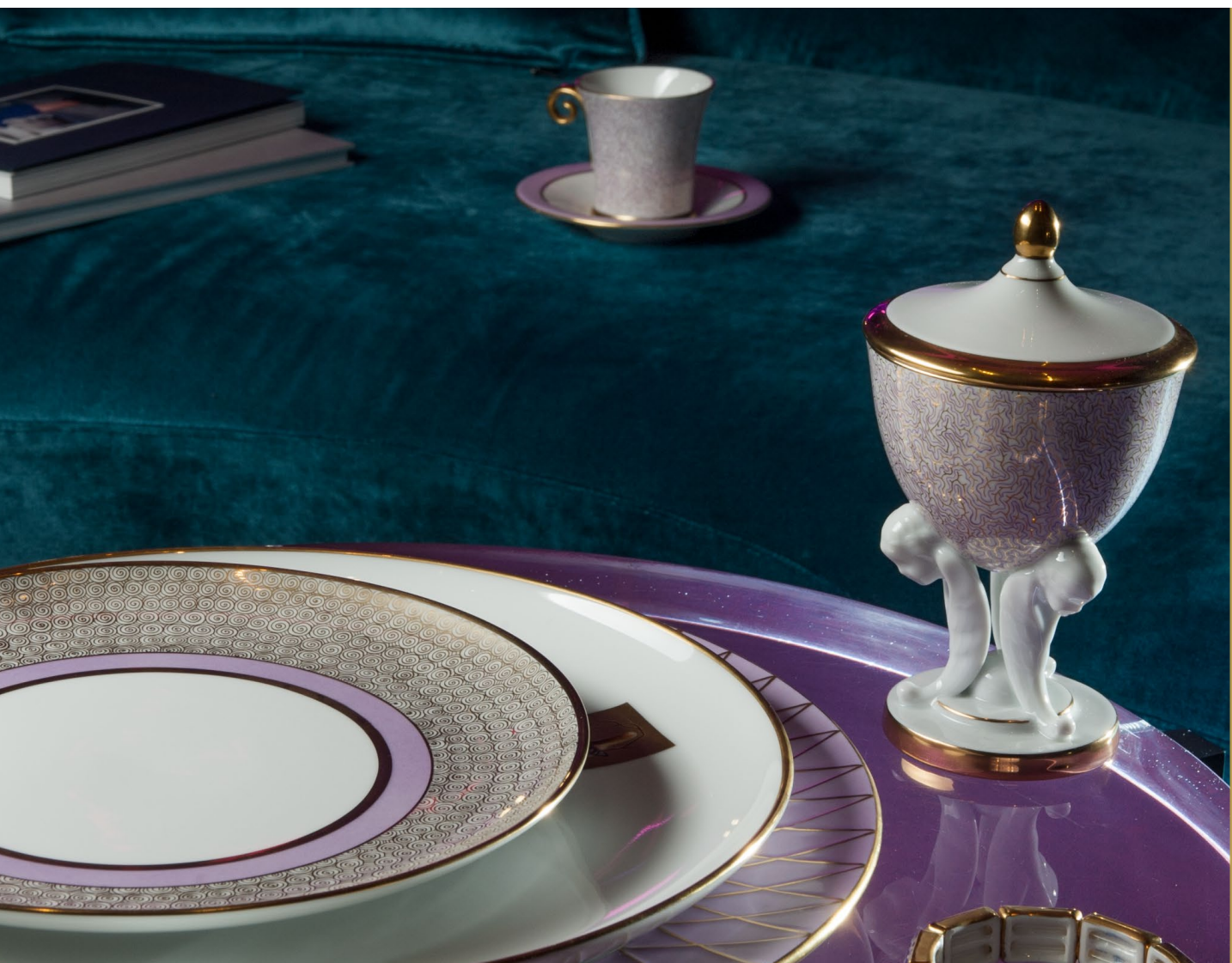
purple • dignity, mistique