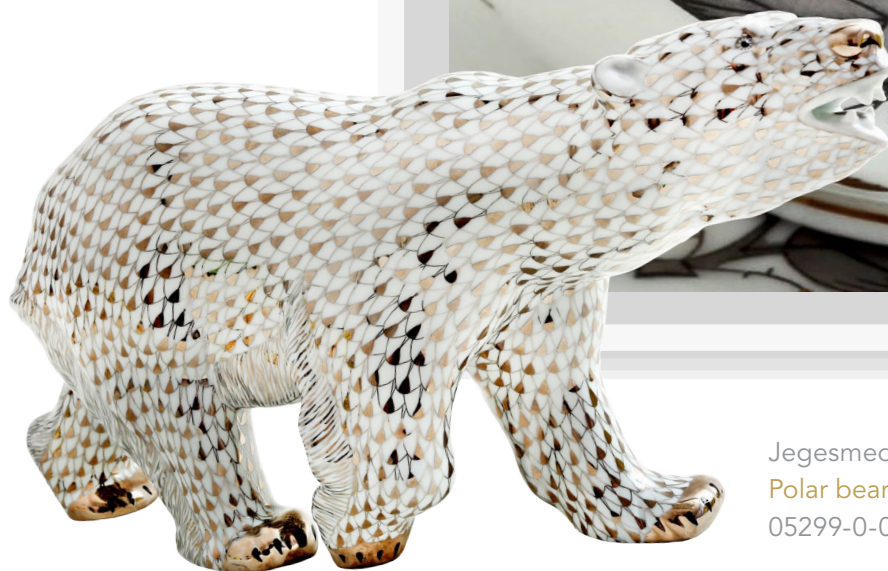
Jegesmedve Polar bear 05299-0-00PTVH