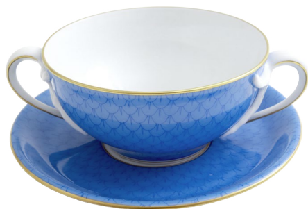
Teáscsésze aljjal Teacup with saucer 04484-0-00MLB