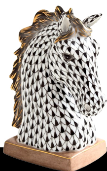
Lófej Horse bust 15715-0-00VHNM