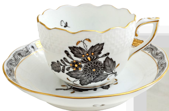
Mokkácsésze aljjal Moccacup with saucer 00711-0-00ANG