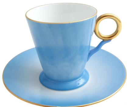
Mokkácsésze aljjal Moccacup with saucer 04915-0-00QHN2