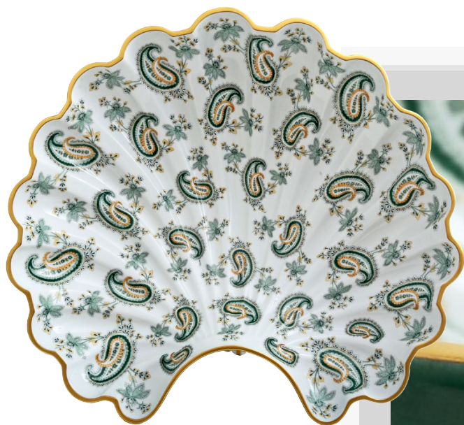
Kagyló, négy lábon Shell on feet 07591-0-91SPBUTV