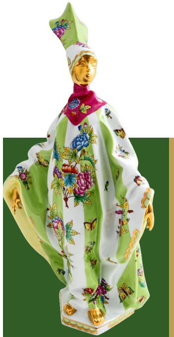
Karneváli nő Carnival woman 15011-0-00VBO