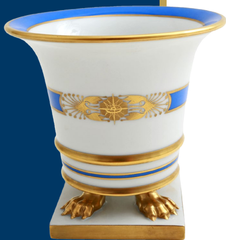
Váza Vase 06403-0-000RB