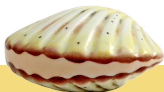
Tengeri kagyló Sea shell 15534-0-00C