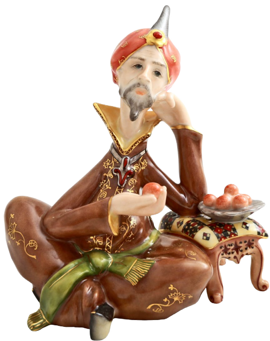
Öreg török Old Turkish 15416-0-00CD1