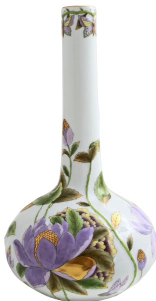
Váza, relieffel Vase, embossed 07141-0-00EVICT4