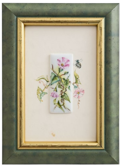
Falikép Wall plaque 08191-0-00MID-14