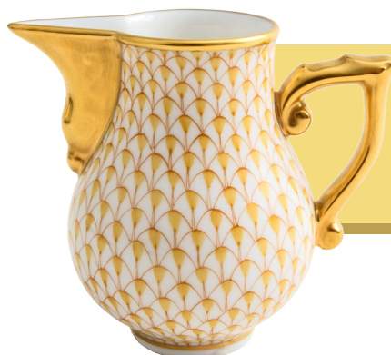
Tejeskanna Milkjug 20658-0-00VHJ