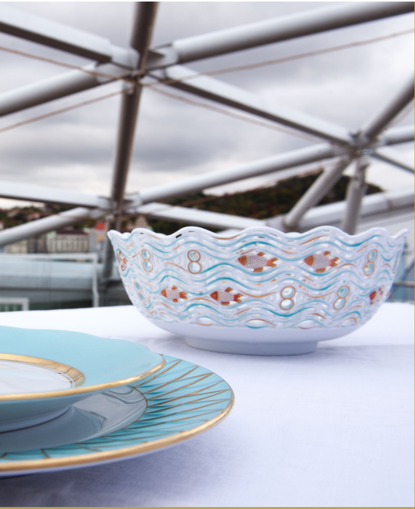
turquoise • power, vitality