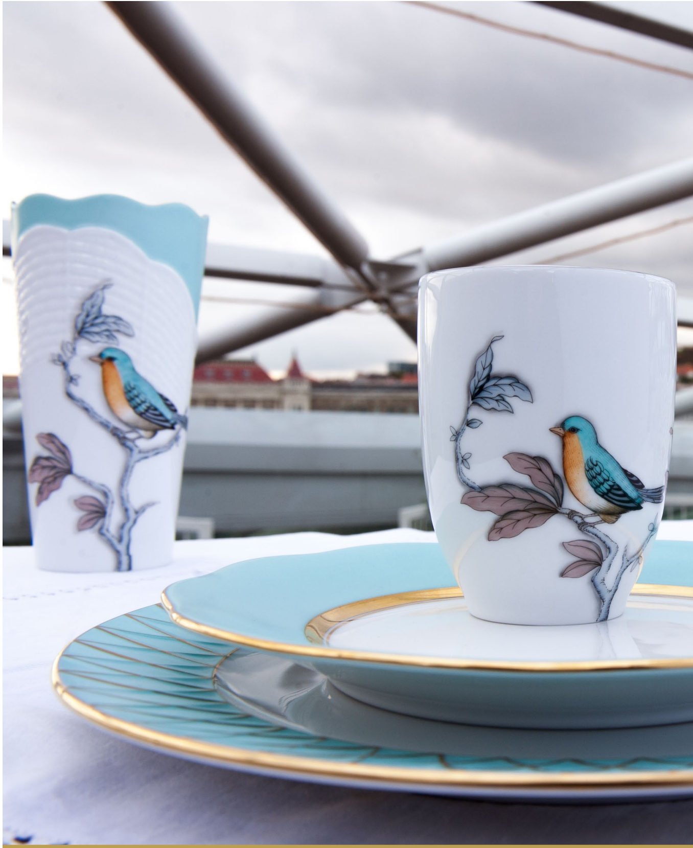
türkizkék • erő, vitalitás