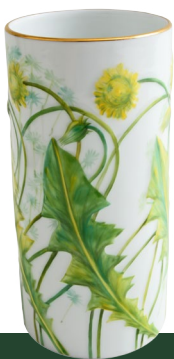
Váza, relieffel Vase, embossed 07162-0-00CD