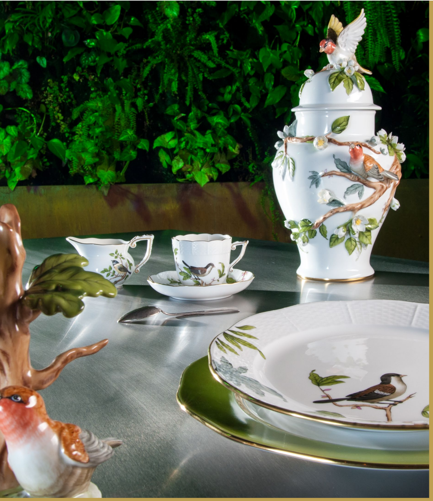
green • bounty, fantasy