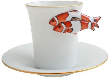
Mokkácsésze aljjal Moccacup with saucer 04913-0-00QHCD-1