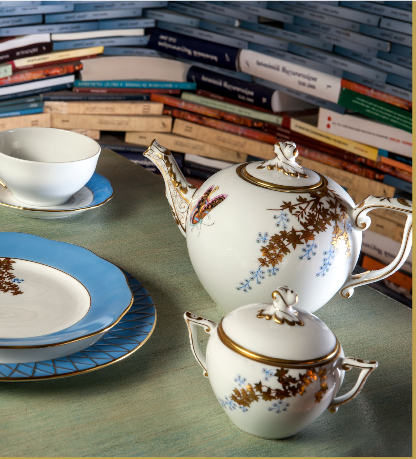
blue • justice, patience