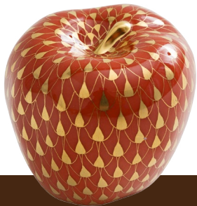
Levélnehezék Paperweight 08555-0-00VH-OR