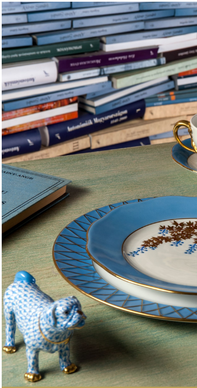
kék • igazság, türelem