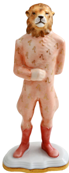
Oroszlán Leo 15547-0-00CD