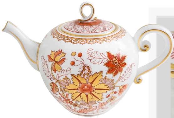
Teáskanna Teapot 02607-0-13TUNG