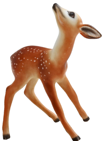
Ózgida Fawn 15287-0-00MCD