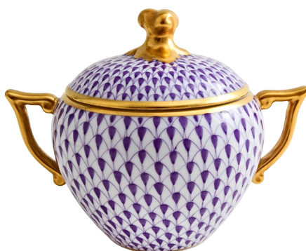
Cukortartó Sugar basin 20471-0-06VHL