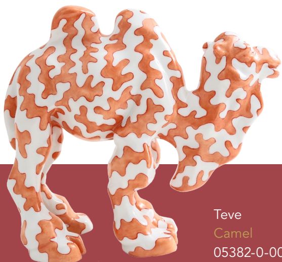
Teve Camel 05382-0-00JH31