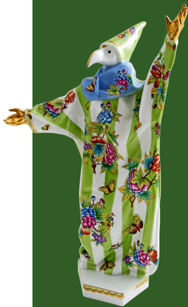
Karneváli férfi Carnival man 15004-0-00VBO