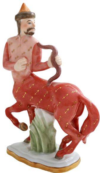
Nylas Sagittarius 15551-0-00CD