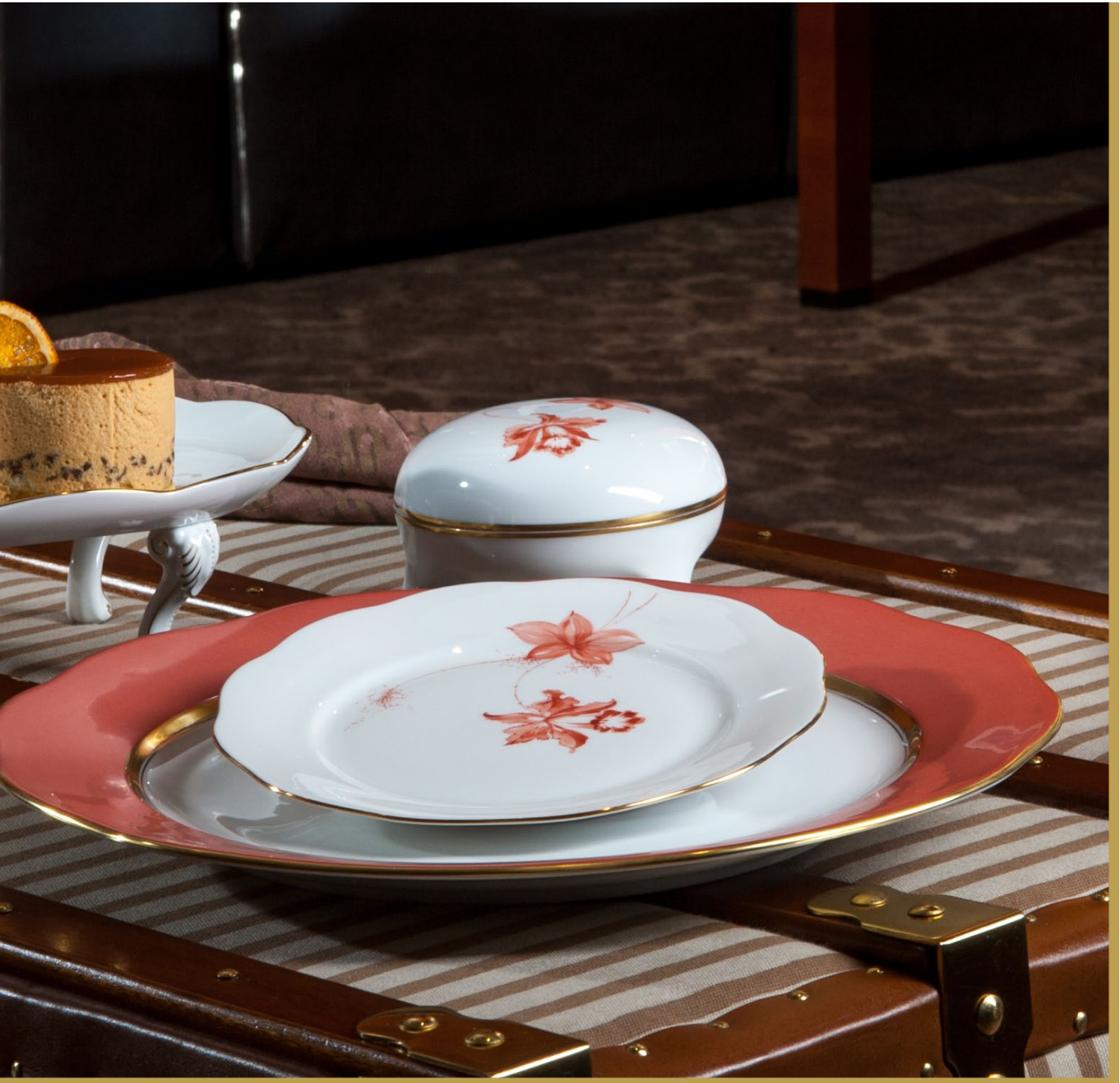
salmon-red • sensuality, desire