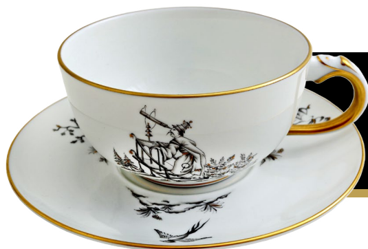
Teáscsésze aljjal Teacup with saucer 03472-0-00CHARMON-OR