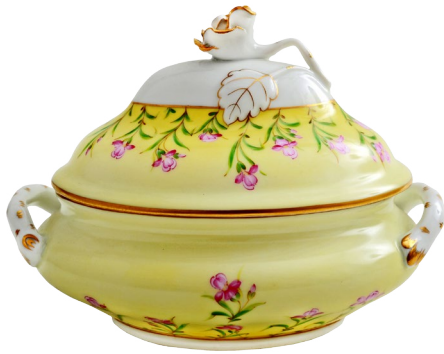
Bonbonnier Bonbonniere 06017-0-09IRIS-J