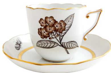
Kávészsésze aljjal Coffeecup with saucer 20706-0-00VICTMC3