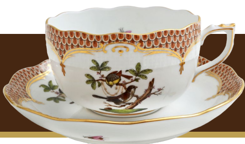
Teáscsésze aljjal Teacup with saucer 00724-0-00RO-EM