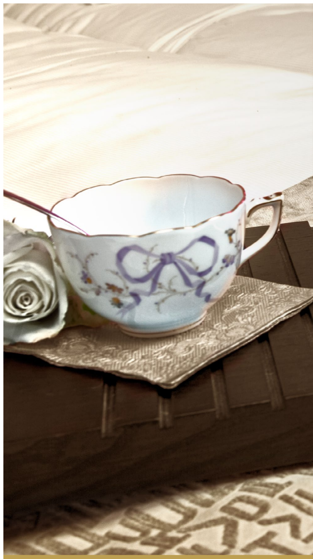
mogyoróbarna • biztonság, természetesség