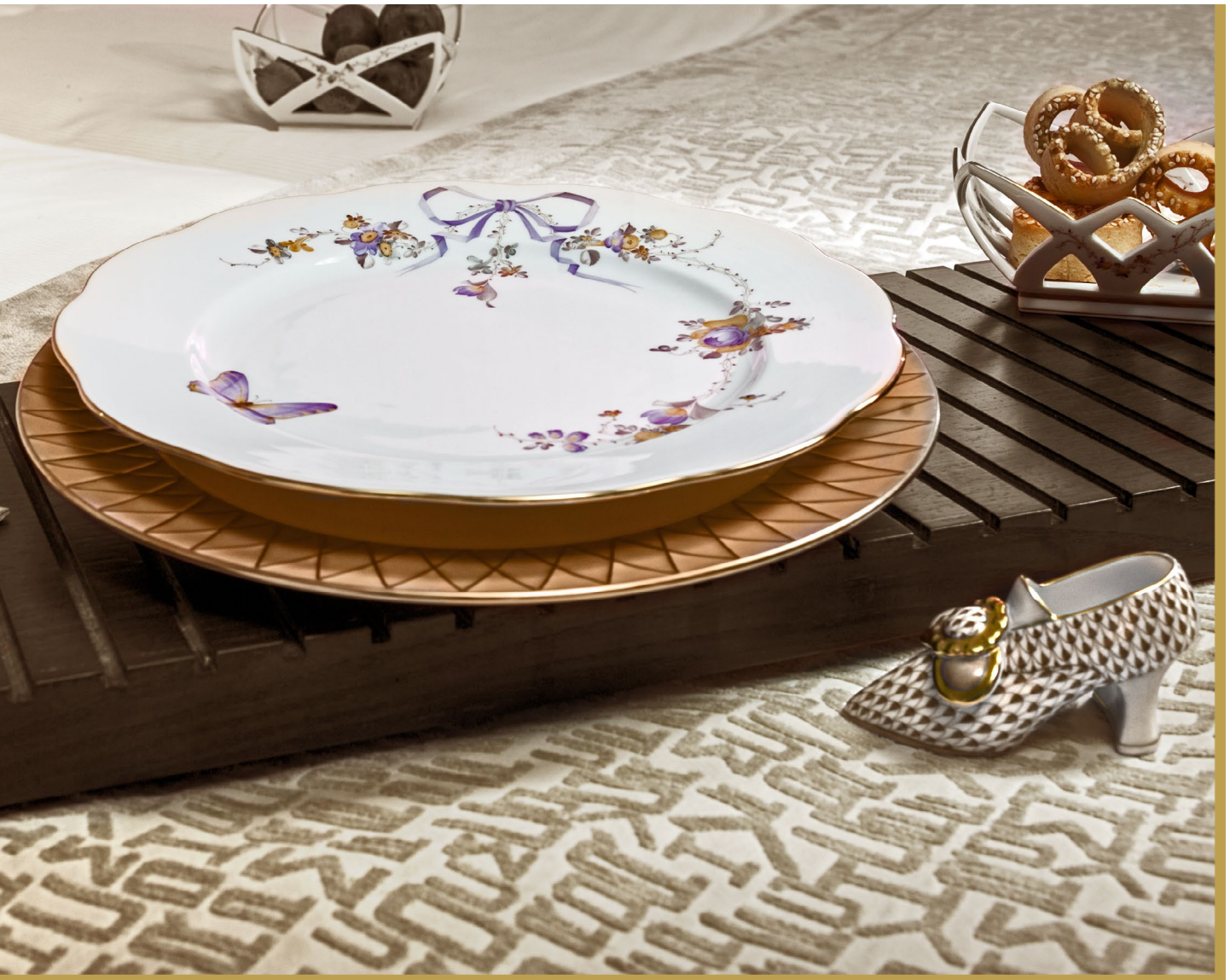
hazelnut brown • safety, naturalism