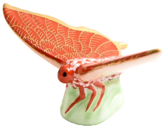
Lepke Butterfly 15063-0-00VHM