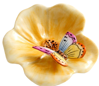
Mályvavirágon lepke Butterfly on flower 09252-0-17CD1