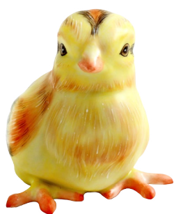
Kiscsibe Baby chick 15850-0-00MCD