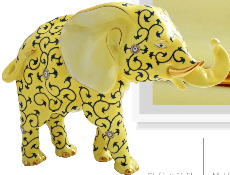
Elefántkölyök Elephant-baby 05214-0-00SJ