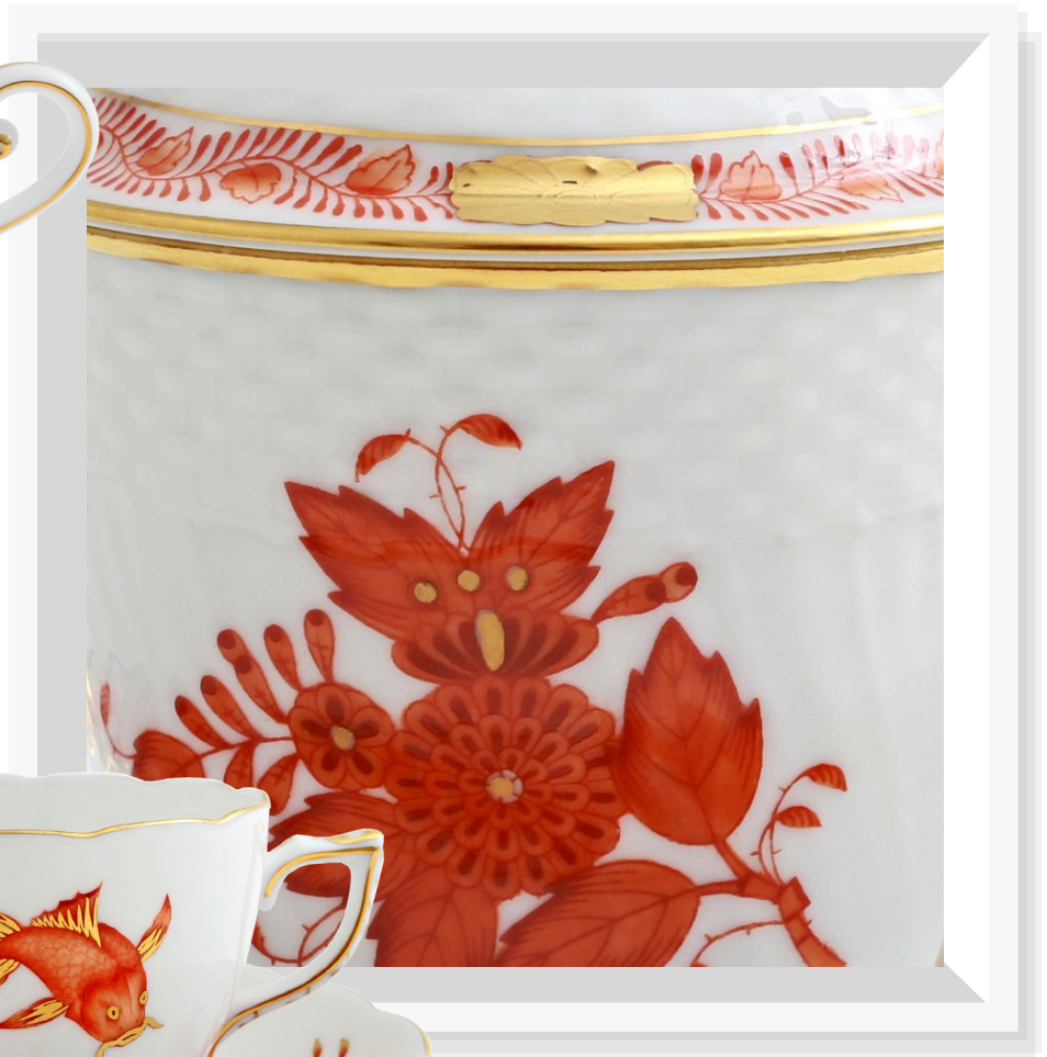
Teáscsésze aljjal Teacup with saucer 20701-0-00COPOH