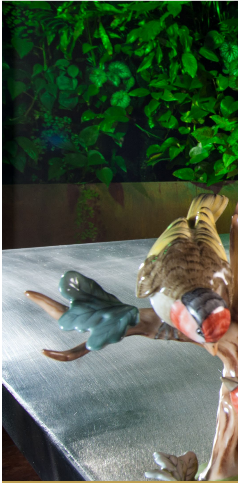
zöld • nagylelkűség, képzelőerő