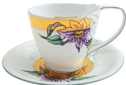
Kávészsésze aljjal Coffeecup with saucer 04682-0-00RETE