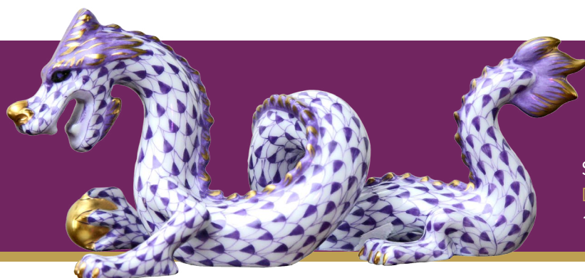
Sárkány Dragon 15601-0-00VHL