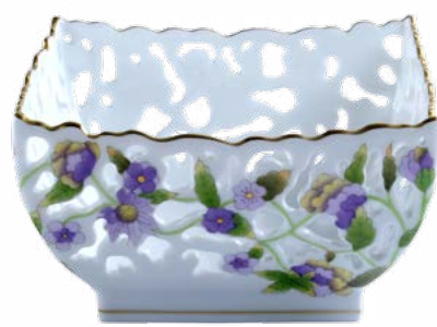
Díztál, áttört Fancy dish, open-work 7367-0-00/C4