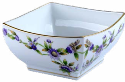
Díztál Fancy dish 2187-0-00/C4