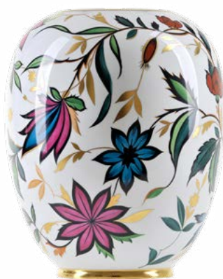
Váza Vase 7120-0-00/SP837