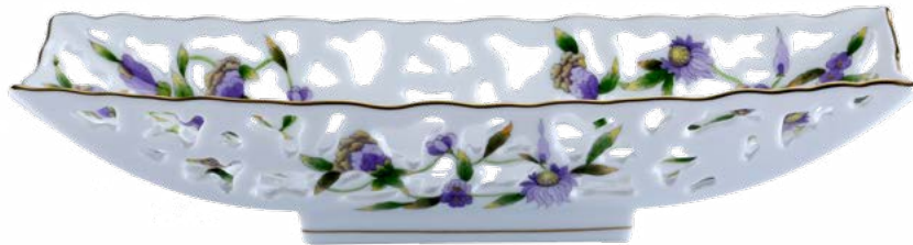
Díztál, áttört Fancy dish, open-work 7349-0-00/C4