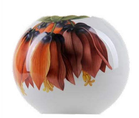
Váza Vase 7343-0-00/GRF-FI