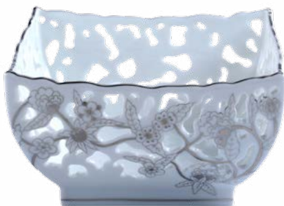
Díztál, áttört Fancy dish, open-work 7367-0-00/CPT