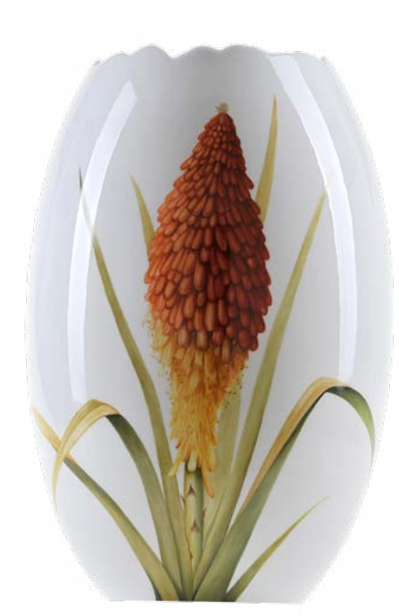
Váza Vase 7341-0-00/GRF-KL