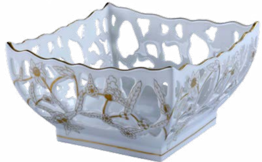
Díztál, áttört Fancy dish, open-work 7368-0-00/COR