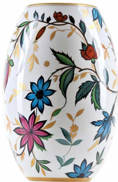
Váza Vase 7007-0-00/SP837