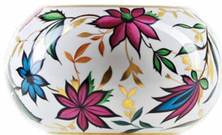
Váza Vase 7006-0-00/SP837