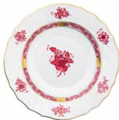
APPONYI MAUVE (AP2)