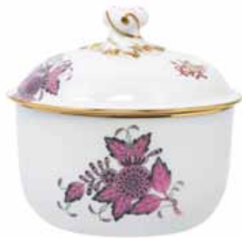
CUKORTARTÓ, CSAVARTFOGÓVAL (20462-0-06 CLOTP)