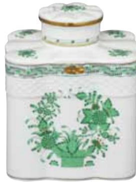
TEADOBOZ (06376-0-00 FV)