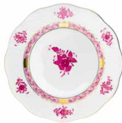
APPONYI POURPRE (AP)