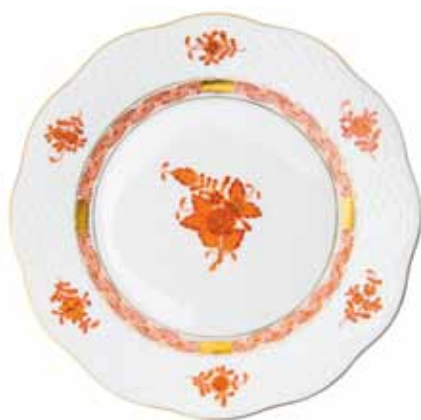
APPONYI ORANGE (AOG)