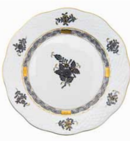
APPONYI GRIS (ANG)