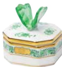
DÍSZDOBOZ, LEPKEFOGÓVAL (06105-0-17 AV)