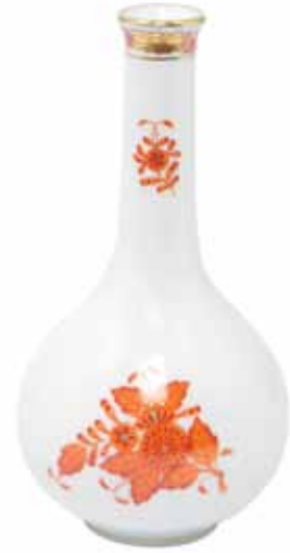
VÁZA (07104-0-00 AOG)