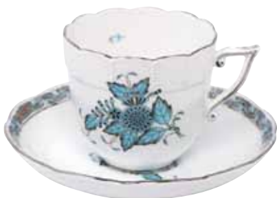
KÁVÉSCSÉSZE ALJJAL (00706-0-00 ATQ3-PT)