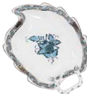
LEVÉLALAKÚ TÁL, BALRA FORDULÓ (00205-0-00 ATQ3-PT)