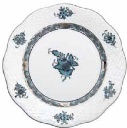
APPONYI TURQUOISE PLATINUM (ATQ3-PT)