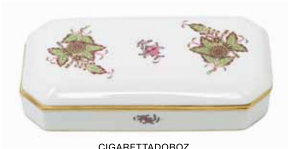
CIGARETTADOBOZ (07897-0-00 CLOTV)