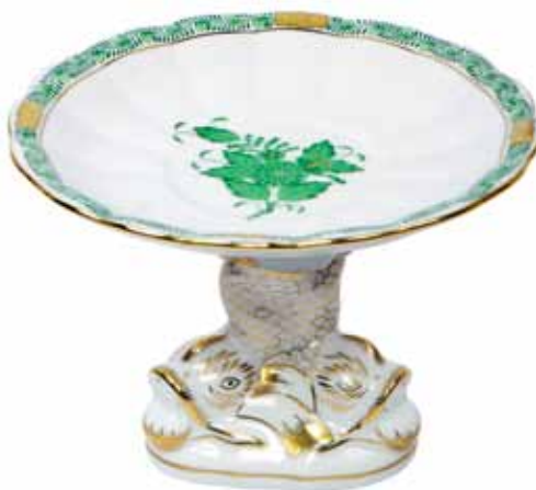
DÍSZTÁLKA (07557-0-00 AV)