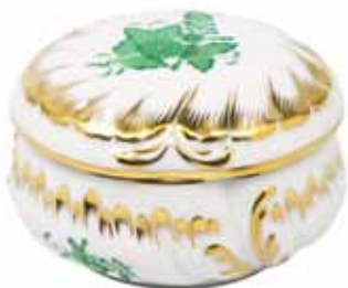
BONBONIER (06035-0-00 AV)