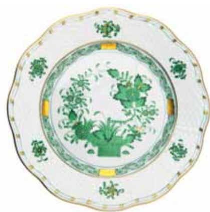
FLEURS DES INDES VERTES (FV)