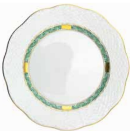
APPONYI VERT SIMPLE (ASV)