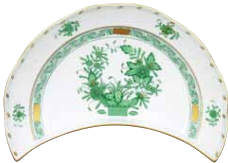
CSONTTÁNYÉR (00530-0-00 FV)