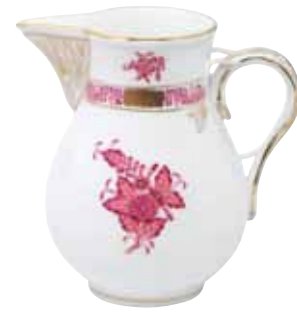
TEJESKANNA (01653-0-00 AP2)