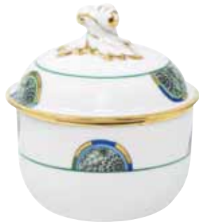
CUKORTARTÓ, CSAVARTFOGÓVAL (02463-0-06 MED)