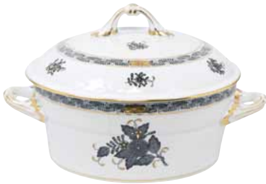
FŐZELÉKESTÁL, SZALAGFOGÓVAL (00041-0-07 ANG)