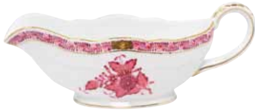
MÁRTÁSTÁL (01218-0-00 AP2)