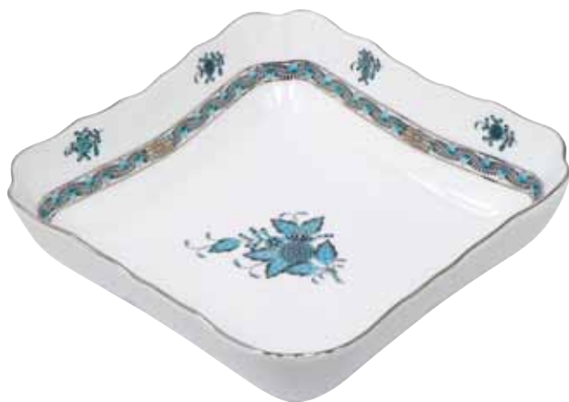
SALÁTÁSTÁL (00181-0-00 ATQ3-PT)