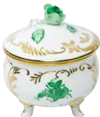
BONBONIER, RÓZSAFOGÓVAL (06040-0-09 AV)