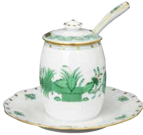
MUSTÁRTARTÓ, GOMBFOGÓVAL (00241-7-15 FV)