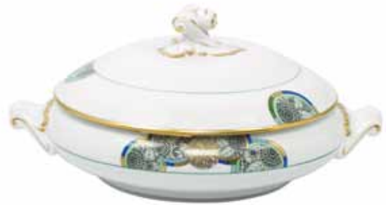
FŐZELÉKESTÁL, CSAVARTFOGÓVAL (02086-0-06 MED)