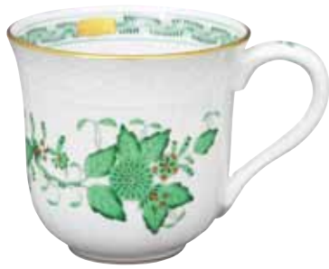
TEJESBÖGRE (01729-0-00 FV)