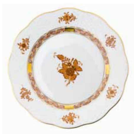
APPONYI MARRON (AM)