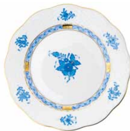
APPONYI BLEU (AB)