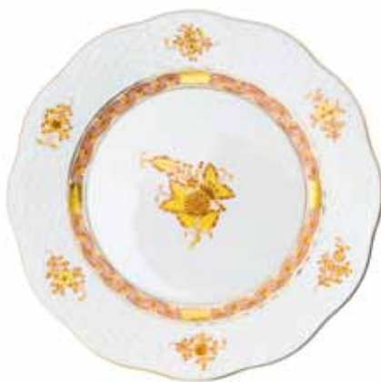
APPONYI JAUNE (AJ)