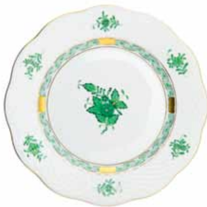
APPONYI VERT (AV)