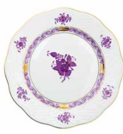
APPONYI LILAS (AL)