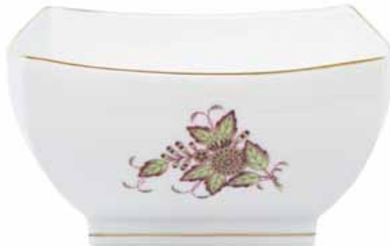
NÉGYSZÖGLETES TÁL (02185-0-00 CLOTV)