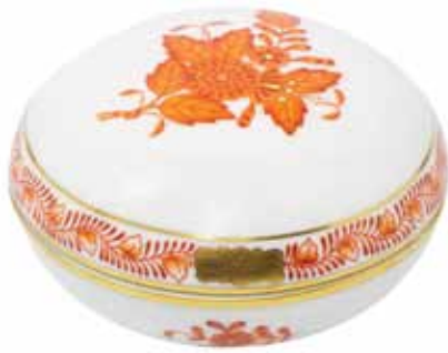
BONBONIER (06021-0-00 AOG)