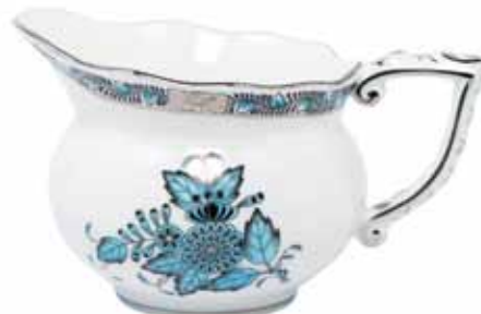
TEJSZÍNESKANNA (00642-0-00 ATQ3-PT)