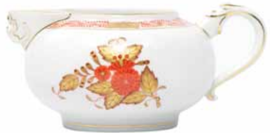
TEJSZÍNESKANNA (03443-0-00 APER-OR)