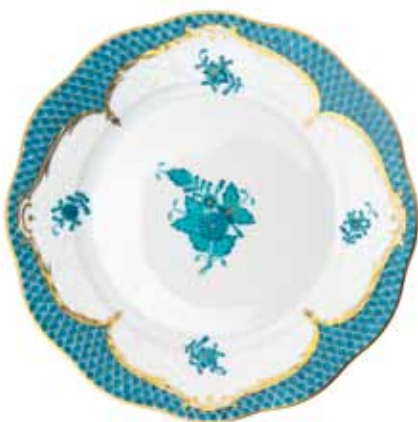
APPONYI TURQUOISE, ÉCAILLES TURQUOISES (ATQ-ETQ)