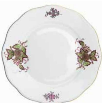
CLOTHILDE VERTE (CLOTV)