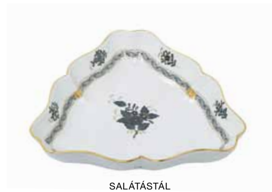
SALÁTÁSTÁL (00191-0-00 ANG)