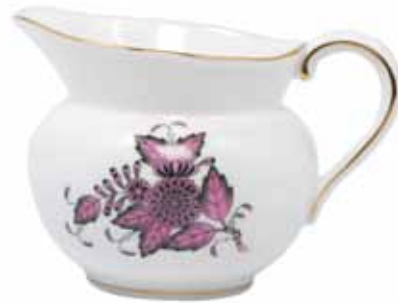
TEJSZÍNESKANNA (02642-0-00 CLOTP)