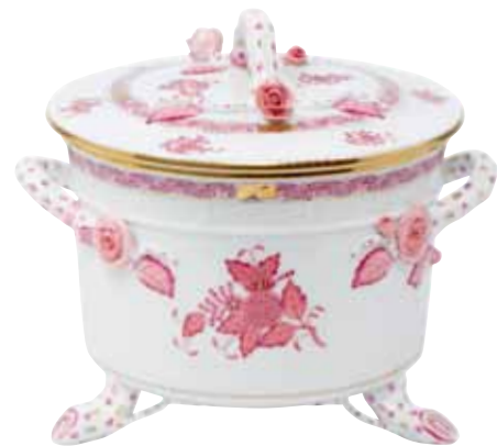
KEKSZDOBOZ, ÁGFOGÓVAL (06300-0-02 AP2)