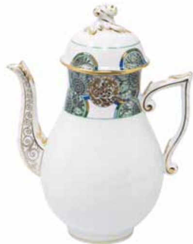
KÁVÉSKANNA, CSAVARTFOGÓVAL (20612-0-06 MED)