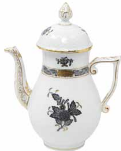
KÁVÉSKANNA, AKANTUSZFOGÓVAL (00613-0-23 ANG)