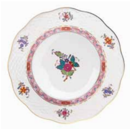
APPONYI FLEUR (AF)