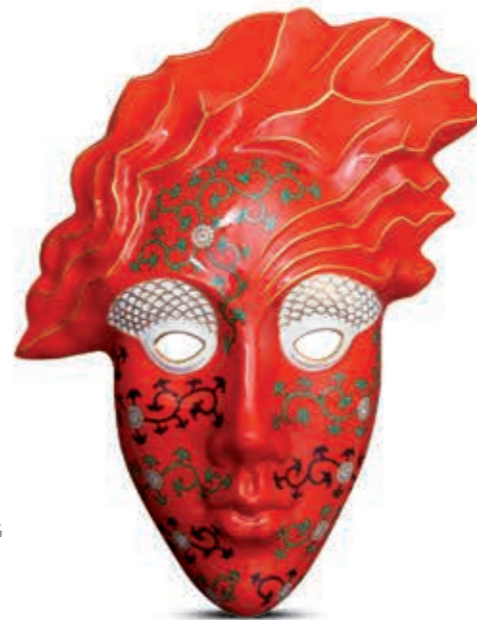
Mural Álarc 15042000 G