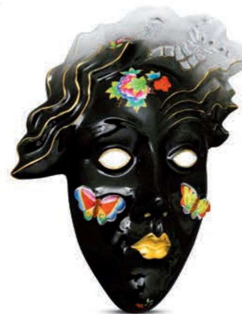
Mural Álarc 15046000 VE-FN