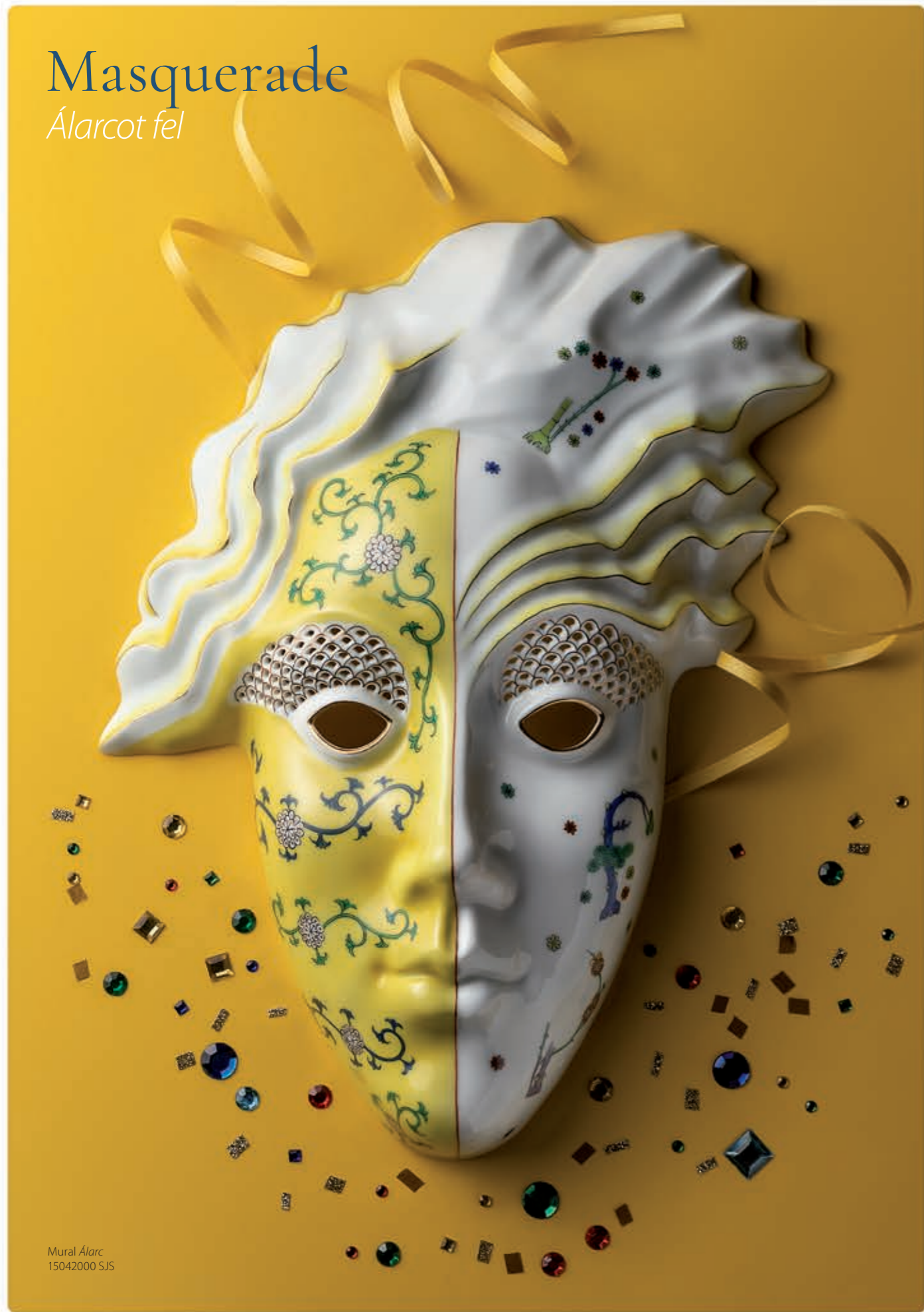
Mural Álarc 15042000 SJS