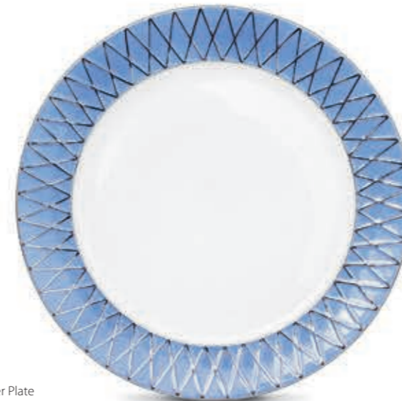
Dinner Plate Lapostányér 04761000 BABOSB-OR