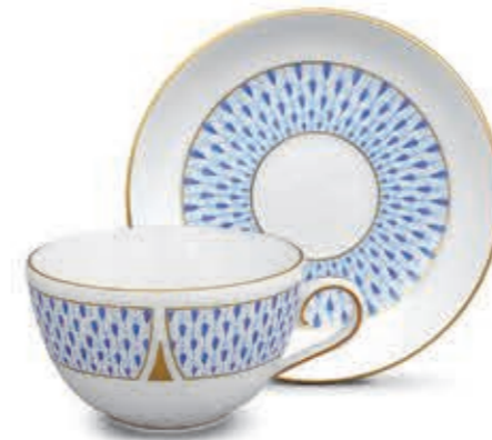
Teacup Teáscsésze 2703200 VHNKB Saucer Csészealj 02703100 VHNKB