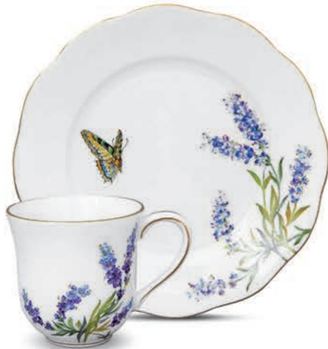
Milk mug Tejesbögre 02729000 PLMP-4 Dessert plate Csemegetányér 20519000 PLMP-4