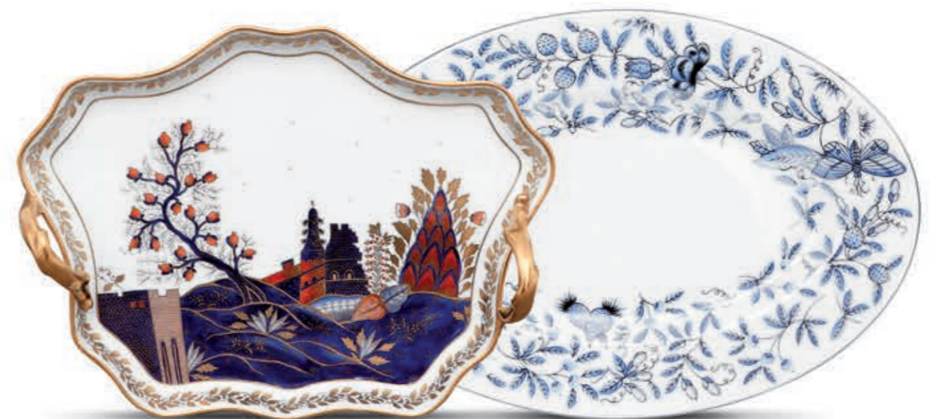
Platter Tálca 20421000 MRM