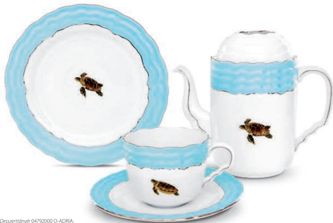
Dessert plate Desszerttányér 04792000 O-ADRIA; Saucer Csészealj 04791-1-00 O-ADRIA; Cup Csésze 04791200 O-ADRIA; Teapot Tedskanna 04790000 O-ADRIA