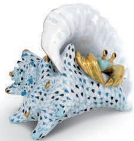
Shell with crab (Limited Edition) Rák kagylóban (Limitált kiadás) 05785000 VHSP201