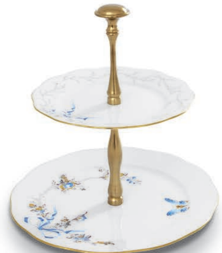
Two tier fruit stand Kétrészes gyümölcsállvány 20308094 GY7