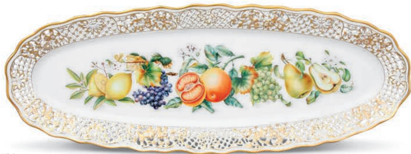
Wall plate Áttört falitál 08404050 SP286