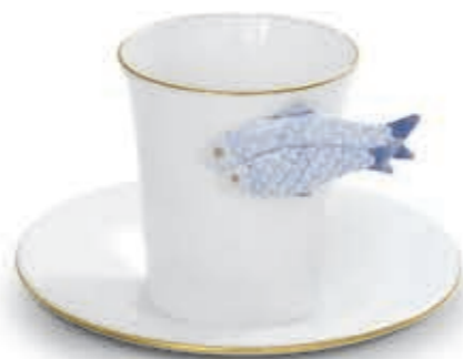
Moccacup with saucer Kávészésze csészealjjal 04913200 QH-NHFB