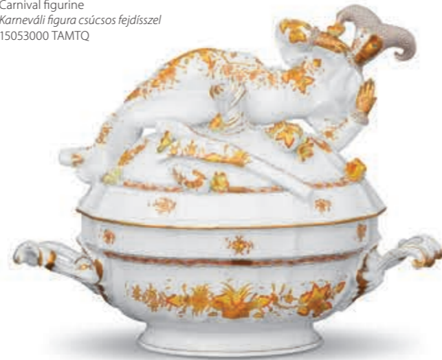
Carnival-figurine (Limited edition) Karneváli alak levestálon (Limitált kiadás) 15026000 FJ