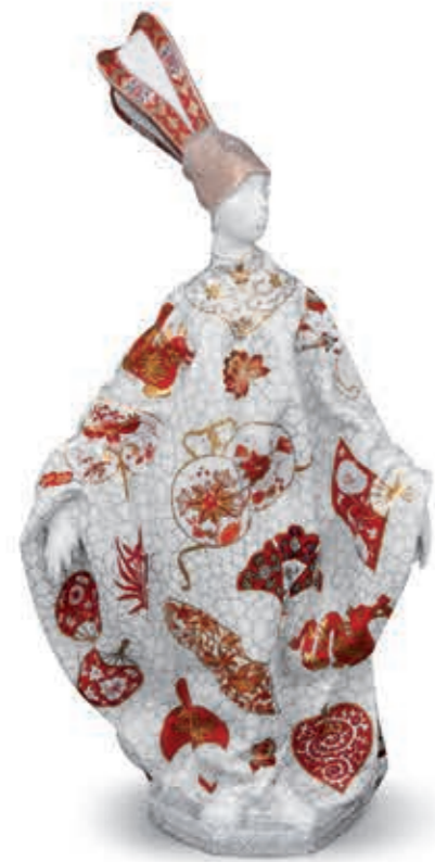
Carnival woman in costume (Limited edition) Karneváli nő jelmezben (Limitált kiadás) 15011000 MONT1