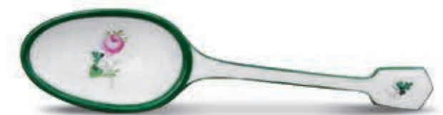
Sauce ladle Mártás kanál 00238000 VRH