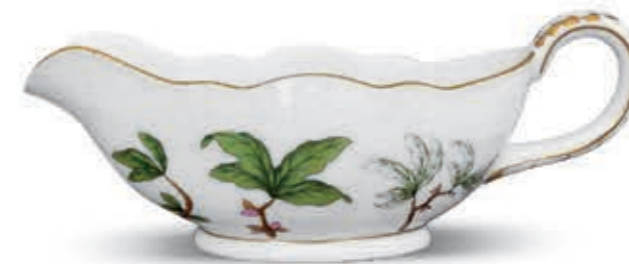
Sauce boat Mártástál 00217000 FORETGD