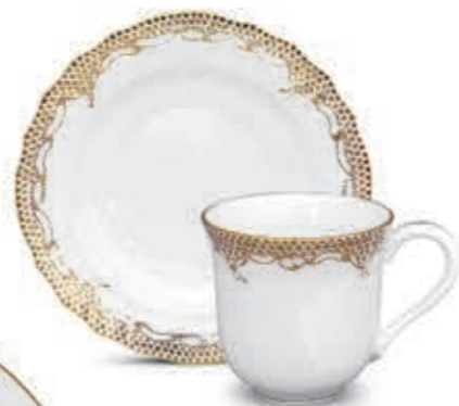
Milk mug Tejesbögre 01729000 A-ETOR Dessert plate Csemegetányér 01518000 A-ETORD