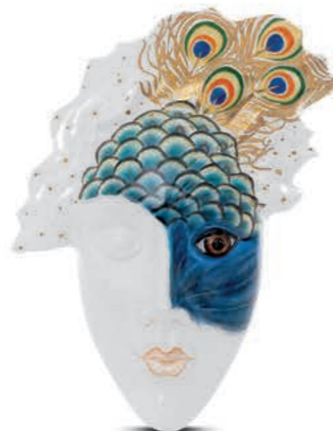
Mask Álarc 15040091 SP1206