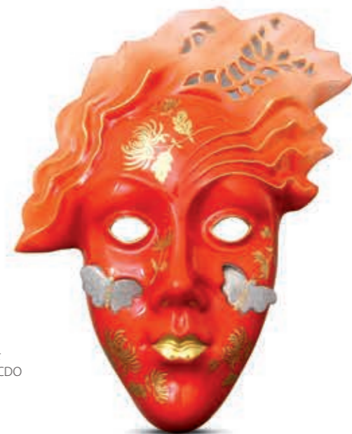
Mural Álarc 15046000 CDO