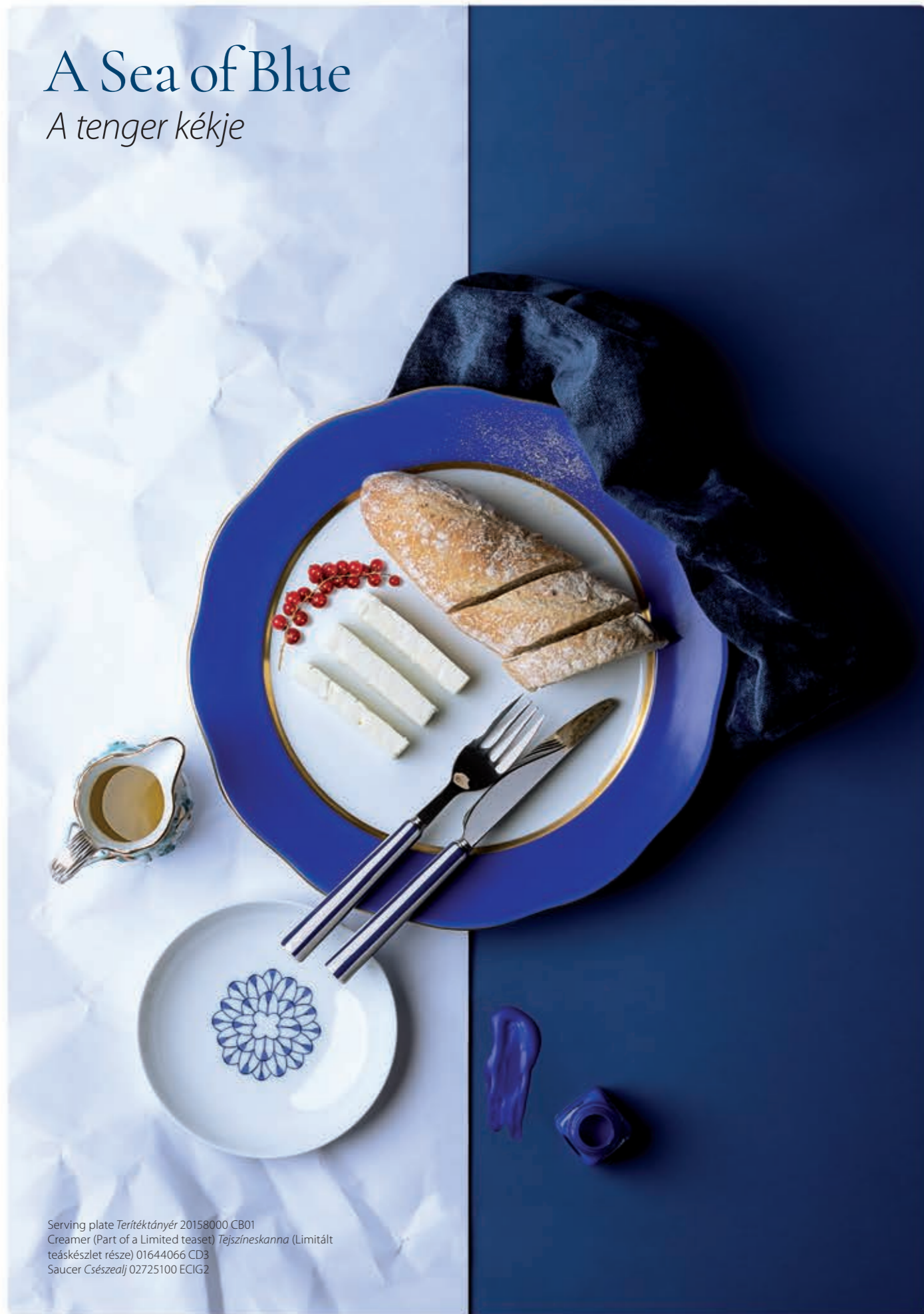
Serving plate Terítéktányér 20158000 CB01 Creamer (Part of a Limited teaset) Tejszíneskanna (Limitált teáskészlet része) 01644066 CD3 Saucer Csészealj 02725100 ECIG2