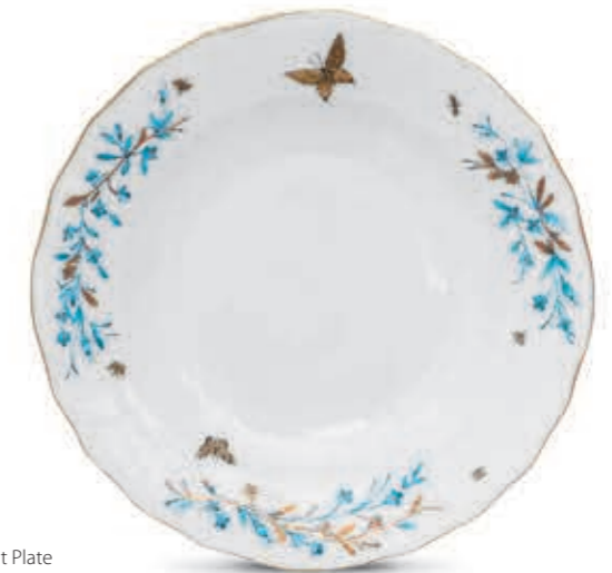
Dessert Plate Desszerttányér 01520000 C12