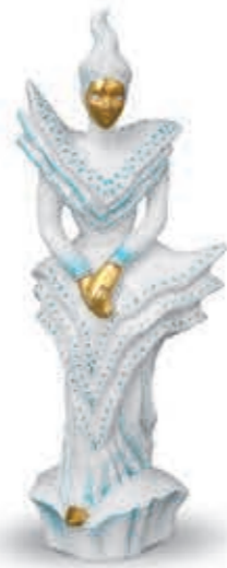
Carnival figurine Karneváli figura csúcsos fejdísszel 15053000 TAMTQ