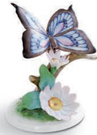
Flowers with butterfly Margaréta lepkével 09306000 CD1