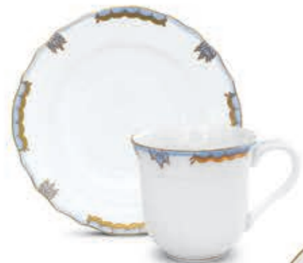
Milk mug Tejesbögre 01729000 FORETGD Dessert plate Csemegetányér 01518000 FORETGD