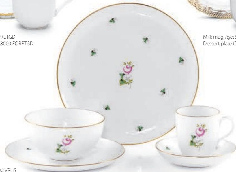
Dinner plate Lapostányér 02537000 VRHS Dessert Plate Desszerttányér 02538000 VRHS Bowl Müziis tálka 02365000 VRHS Coffee cup with saucer Kávészsésze csészealijjal 02725000 VRHS