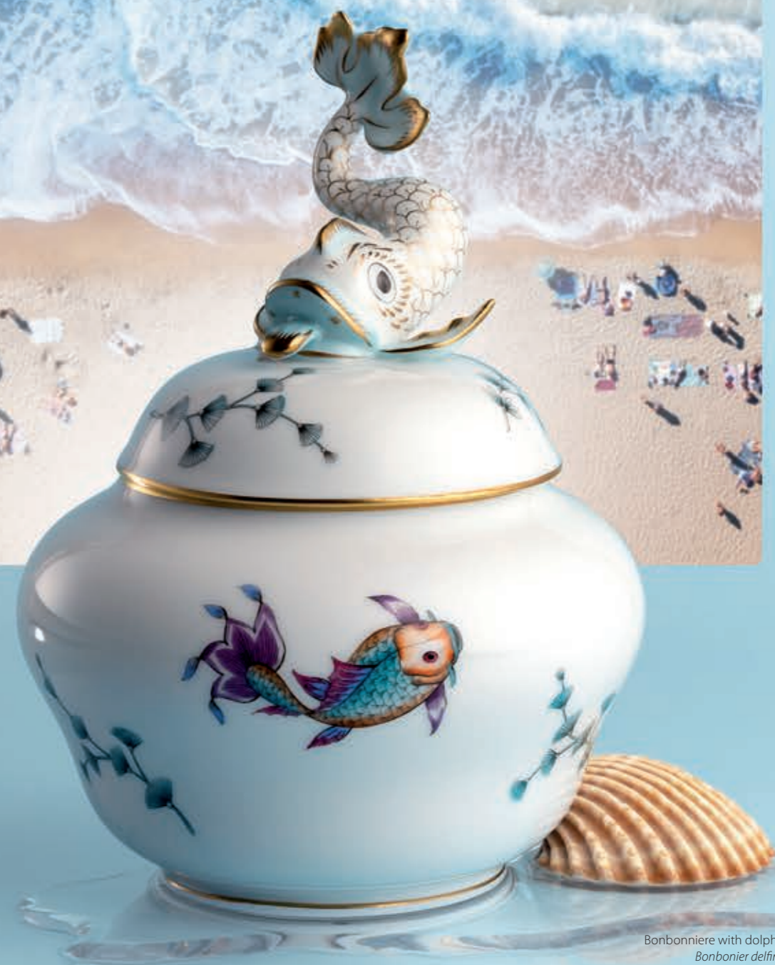
Bonbonniere with dolphin knob Bonbonier delfinfogóval 06092018 COPO