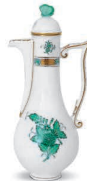
Oilpitcher with butterfly knob Olajtartó lepkefogóval 00680017 AV