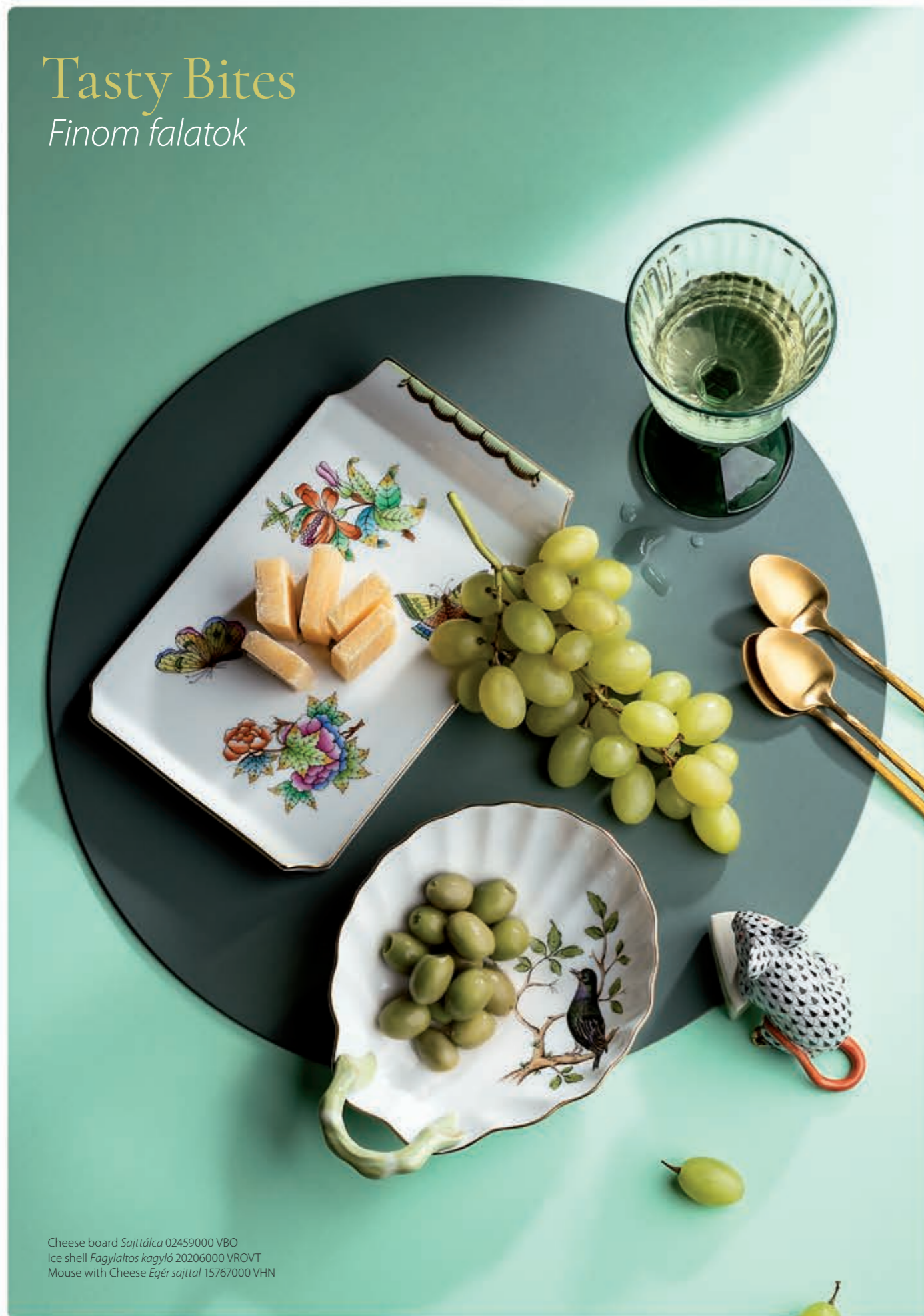
Cheese board Sajttálca 02459000 VBO Ice shell Fagylaltos kagyló 20206000 VROVT Mouse with Cheese Egér sajttal 15767000 VHN