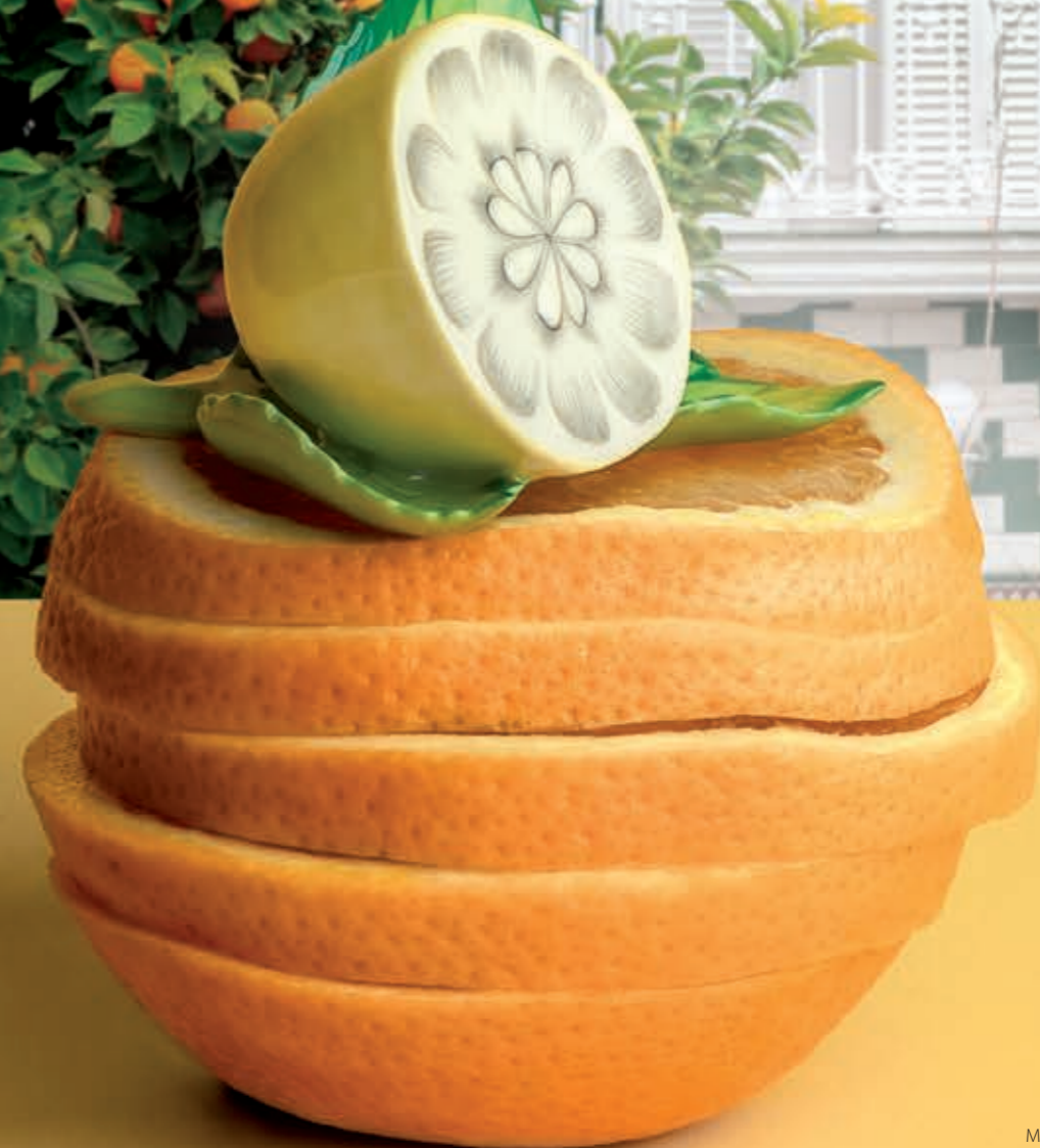
Menu-holder lemon Étrendtartó citrom 08978000 C