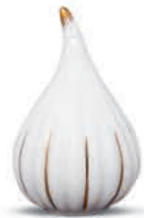
Christmas tree ornament fig Karácsonyfadísz füge 09619091 NM-OR