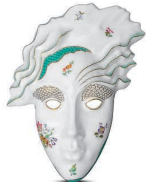
Mural Álarc 15042000 TF