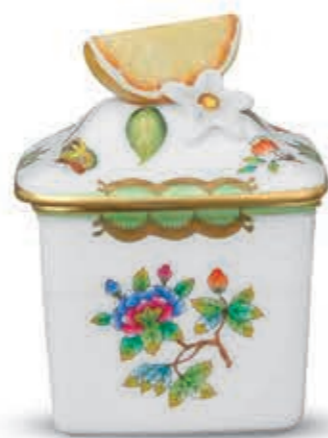
Jam holder Dzsem tartó 00373092 VBO