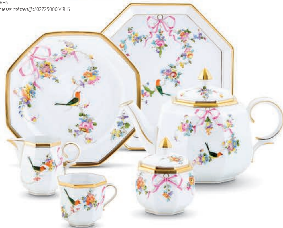
Tray Tálca 04326000 JM; Dessert plate Csemegetányér 04318000 JM; Creamer Tejszíneskanna 04310000 JM; Teapot with button knob Teáskanna gombföggöval 04309015 JM; Teacup Teáscsésze 04304200 JM; Saucer Csészealj 04304100 JM