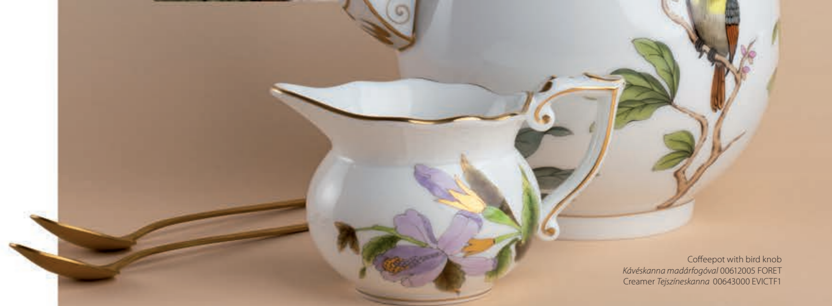
Coffeepot with bird knob Kávéskanna madárföggöval 00612005 FORET Creamer Tejszíneskanna 00643000 EVICTF1