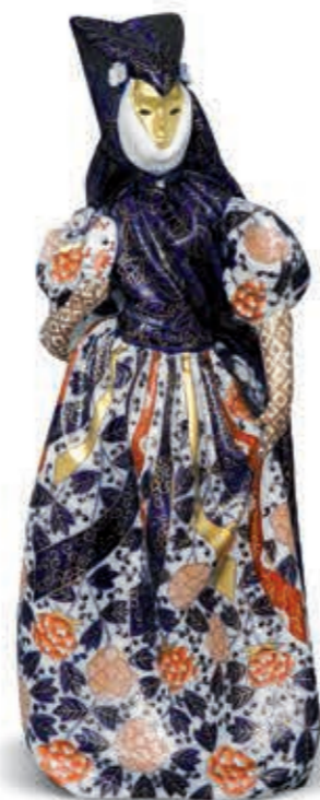
Renaissance woman in shawl (Limited edition) Reneszánsz nő kendőben, sima álarccal (Limitált kiadás) 15023000 BDC-3