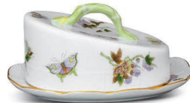
Cheese dish with branch knob Sajttál ágfogóval 00399002 EVICT1