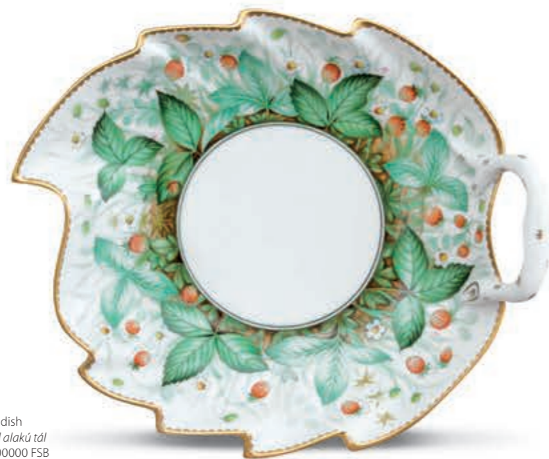
Leaf dish Levél alakú tál 02200000 FSB