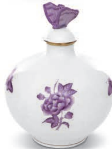
Perfume Bottle with butterfly knob Illatszertartó lepkefogóval 06321017 LVFV