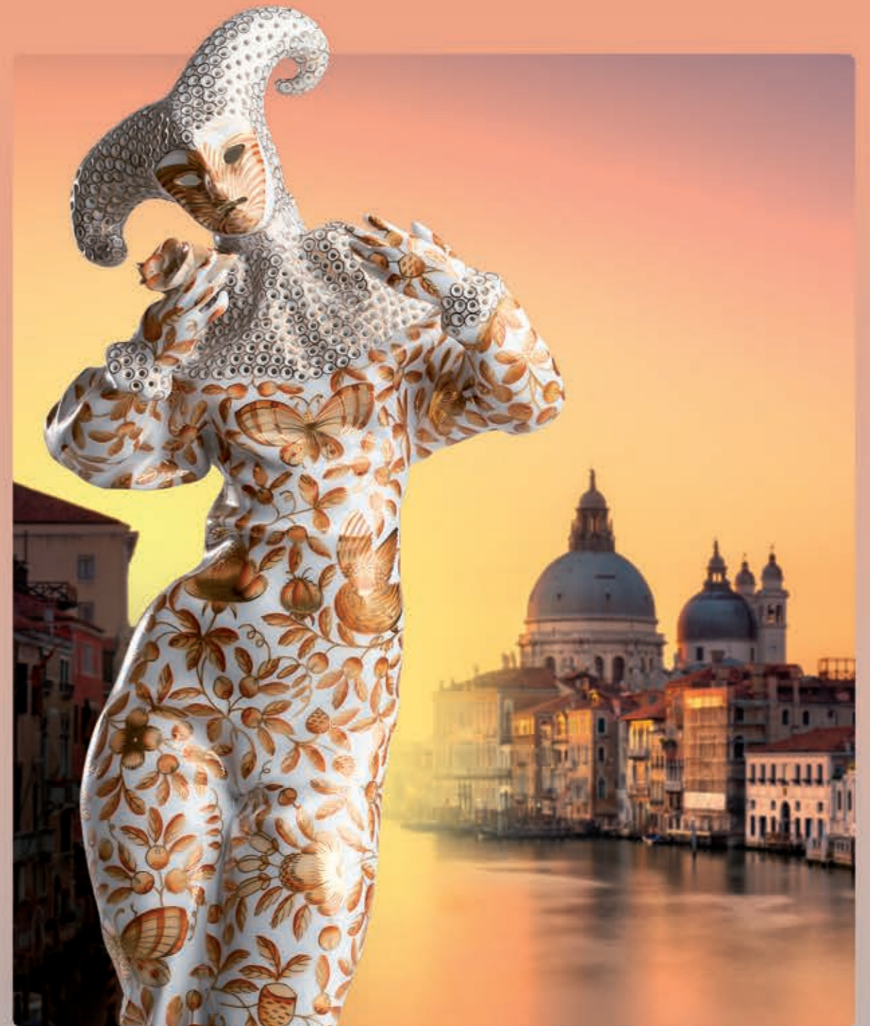
Carnival woman (Limited edition) Karneváli nő (Limitált kiadás) 15006000 ZO