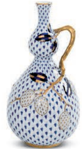
Embossed vase Váza relieffel 07143000 VHSP118