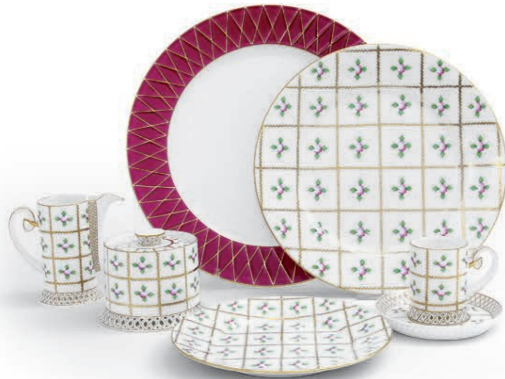
Milk jug Tejeskanna 04758000 SPRO; Sugar basin Cukortartó 04757000 SPRO; Coffee cup with saucer Kávészcészse csészealjjal 04754000 SPRO; Dessert plate Csemegetányér 02518000 SPRO; Dinner plate Lapostányér 02524000 SPRO; Dinner plate Lapostányér 4761000 BABOSP-OR