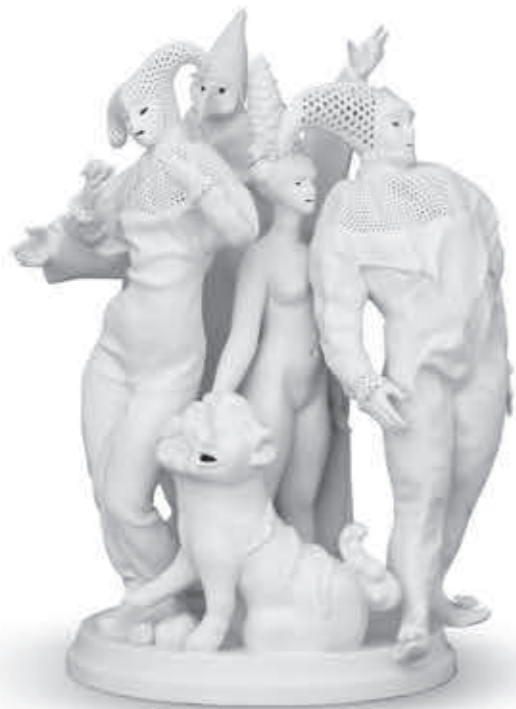
Carnival group (Limited edition) Karneváli csoport Fo-kutyával (Limitált kiadás) 15020000 B